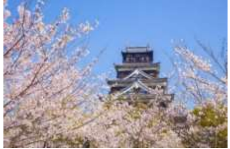
春天的广岛城与樱花