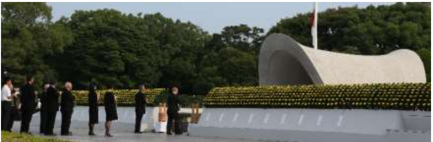
在和平纪念仪式上向慰灵碑献水的市民